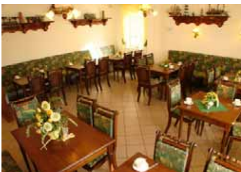
Pension Anker's frukostlokal

På Pension Anker togs vi emot med sedvanlig välkomnande stämning. Vi placerade oss inne i frukostlokalen och lät oss villigt serveras öl och Jägermeister.