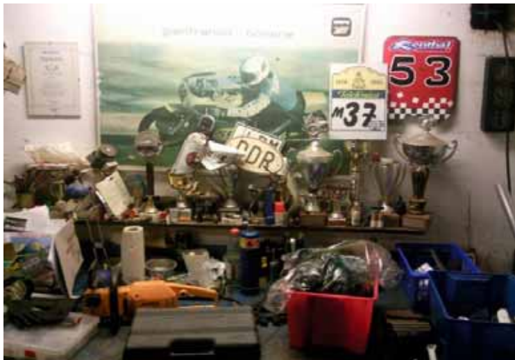
Så här ska det se ut i en riktig verkstad; Grejor överallt, maskindelar i plastbackar, pokaler på hyllan, nummerlapparna på väggen! Men vad gör motorsågen där...

Hur avgör man om man har med en entusiast att göra eller inte? Man tittar in i hans verkstad/garage – är det ordning och reda, välstädat och putsat? Då har man hamnat hos en pedant som ägnar mer tid åt allt annat än motorcyklarna och framförallt att köra dom.