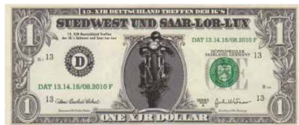
Träffen hade egen valuta som vi betalade med i ölvagnen