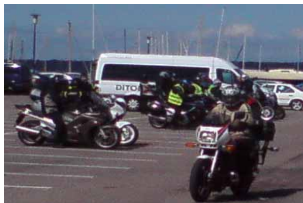
Dags för hemfärd

Prisbordet var bland det bästa jag har sett på alla mina Örerunt (2st körde, 3 som funktionär & 2 som General) – eller vad sägs om 1900:- i presentkort & kläder och prylar värda över 2000:-.