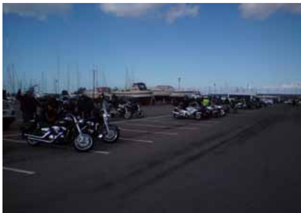
Några av deltagarna står parkerade vid

Väl i Danmark körde vi ned till kontroll 1, för att samla ihop frågor & skyltar. K1 fick i år vara obemannad p g a funktionärsbrist, detta var synd men hade ingen direkt negativ inverkan på deltagarna. Där fann vi tre människor som först då verkade inse att de som hade klurat ihop frågorna var nog inte riktigt kloka (i år igen – hehe!). Därifrån körde vi själva efter kömotema vidare till K2 där vi hittade fler som tyckte att frågorna kunde åtminstone ha skrivits på svenska! När alla hade kommit iväg mot K3 (korvakontrollen) samlades frågor & skyltar in igen och så var det dags för oss att hitta korvarna!