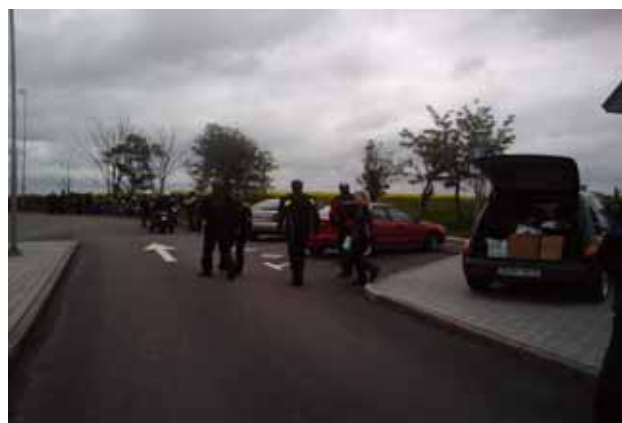
Ett gäng glada motorcyklister ger sig iväg

Som jag har tidigare nämnt så var det kallt & blåsigt vid starten, men när man såg ut över Danmark kunde man se att det skulle bli bättre. Vi hade t o m några som trots att de hade kommit till starten var osäker på om de vill köra, men med några löften om att vädret skulle bli bättre under dagen och fina priser till dem som var bäst körde till slut alla som hade kommit till starten.