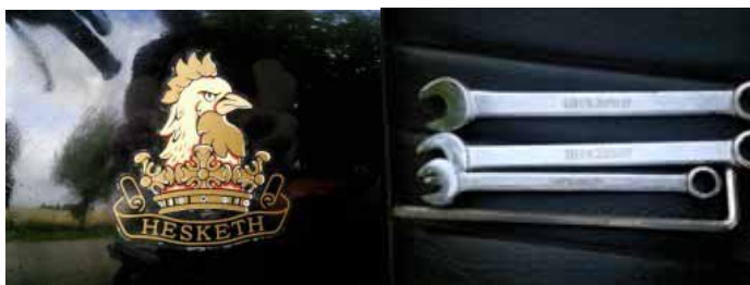
Emblemet skulle ju peka framåt... och en nyckelsats med egen logga på!