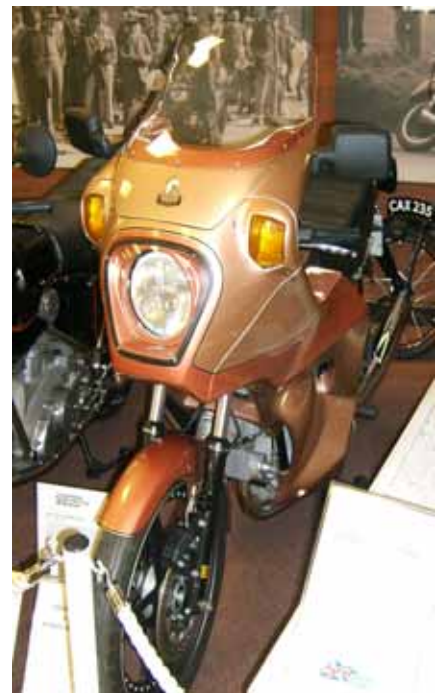
Hesketh Vampire Super Tourer

The Hesketh Owners Club was founded shortly after the close of the original factory by a group of Owners who met at the Factory Auction. Initially formed to mutually help all owners keep their machines on the road the club quickly developed into a very social club with many events through the year. http://www.owners.heskethmotorcycles.co.uk/