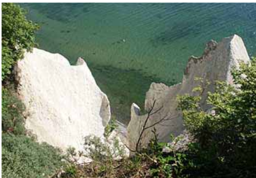
Utsikt vid Wissower Klinken

Gasthaus Waldhalle, som bland annat innefattar den här restaurangen, ligger 200 meter från Wissower Klinken. De är en del av de kritstensklippor som du sitter och njuter av från färjan när du åker till Rügen på endagsresa i syfte att skattefly i Sverige genom att ta in din alkohol från andra länder. Så här ser de ut när du är på plats och står längst upp och tittar ner: