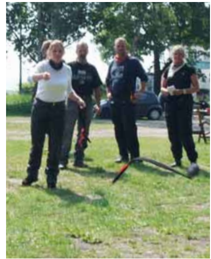
Kast med liten damstrumpa borde ligga väl till för just damerna.

Som vanligt fungerade den verbala vägbeskrivningen perfekt. Vid ett par tillfällen körde jag fel, men skulden för det lägger jag på min egen bristande uppmärksamhet att i tid uppmärksamma de lågt placerade vägs skyltarna i Danmark. Detta beroende på att jag har en väldig benägenhet att vilja se mig omkring för att njuta av omgivningarna. Att samtidigt se alla vägs skyltar, kanske dolda bakom skåpbilar, är inte alldeles lätt.