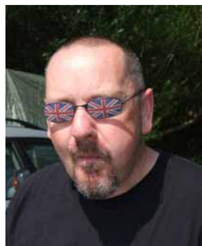
Lokalpatrioter? Nationalister? Tja, den ene påstod sig bära brittbrillor för att få igång/stimulera/provocera den andre. Mimiken på den högra bilden förorsakas av korvätning.

denna trevliga dag spridit sig. 5 av oss deltagare kom från LTT.