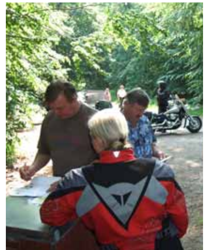
Skugga var en "hett" (ursäkta) eftertraktad artikel denna glödheta dag.