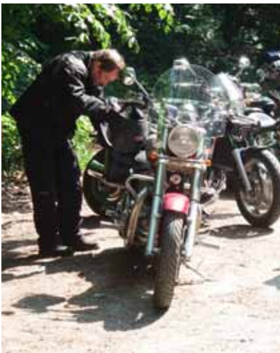
Kontroll nr 2 var obemannad och väl dold bland träd.