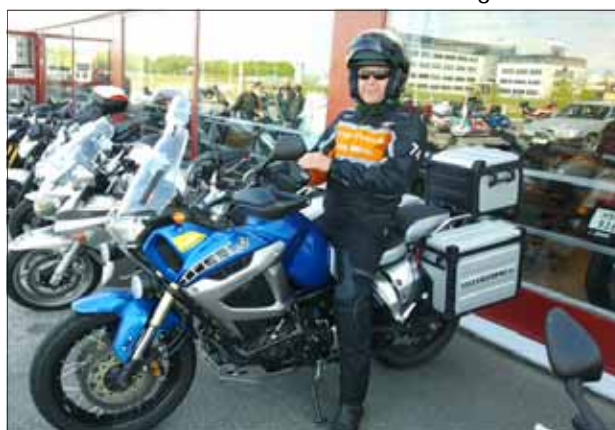
Här ska provas!!!