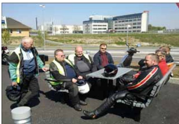
I glada vänners lag utan en droppe sprit - Så visst kan man ha kul utan ...