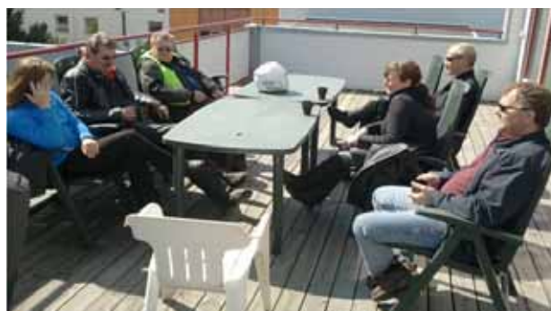
Takterrassen hade många gäster en dag som denna.