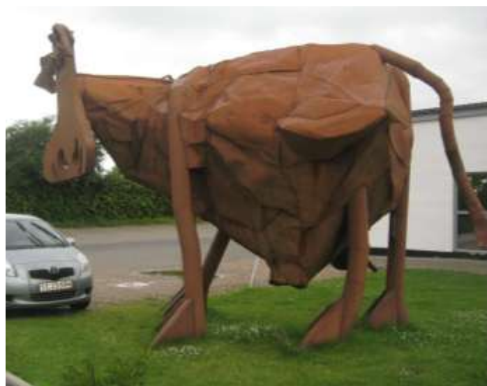
Visst är hon vacker... ??? Muuu!!! ;-)

Strax vi hade kommit i land i Sundsøre körde vi förbi mejeriet i Thiese som står ut med en riktig plåtkossa som reklampelare utanför portarna.