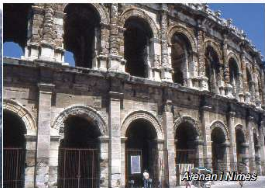
Arenan i Nîmes