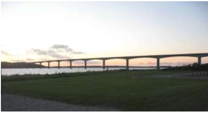
Solnedgång över Limfjorden. Vackert så det förslår! Bro som ersatt tidigare färja. Att utsikten från bron var bedårande behöver kanske inte påpekas?!

Efter att ha ätit mycket gott på kvällen till mycket bra pris och sovit gott i sköna sängar i ett rum med härlig utsikt över Limfjorden körde vi så vidare västerut mot Jyllands västkust.