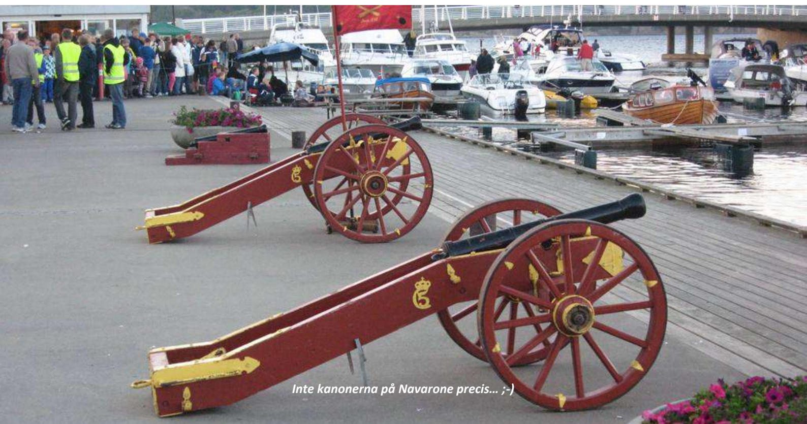
Inte kanonerna på Navarone precis... ;-)