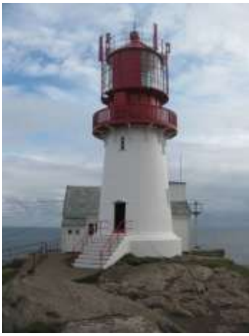
På Norges sydspets ligger Lindesnes fyr som är Norges äldsta fyr och tändes för första gången år 1656.