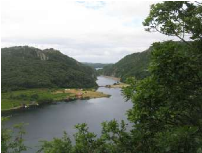
Visst är Norge ett fantastiskt land!