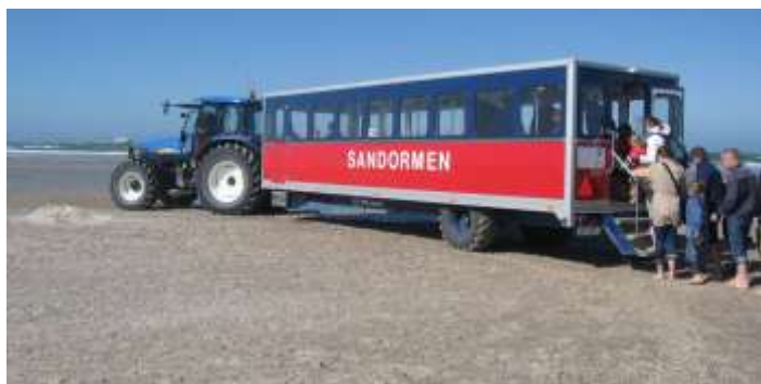
Tur att "Sandormen" fanns! Det var tufft att gå i motvinden och sandstormen som blåste upp alltsomoftast. Dragen av en New Holland, så klart!

För att slippa gå i motvinden tillbaka till parkeringen tog vi "Sandormen" som är en sorts turistbuss som dras av en traktor, av en New Holland! Så klart! Den ena traktorn var en TM140 och den andra var en T6080. Inga muskel-lösa maskiner!