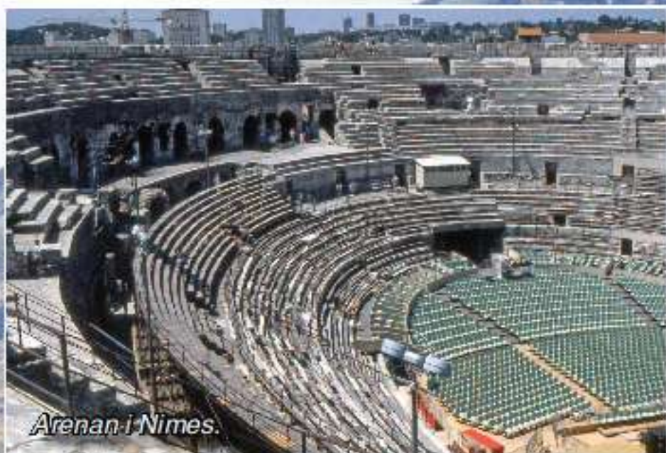
Arenan i Nîmes.

På tåget sover vi 4 och 4 i 5-bäddskupéer. Den 5:e bädden får bli avläggningsplats för mc-kläder, hjälmar, väskor etc. I kupén finns bara handfat. WC och tvättstall/dusch finns i vagnen. Inkvarteringen på hotell, B&B, pensionat "i land" sker i möjligaste mån i dubbelrum med eget badrum.