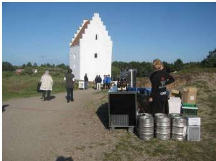
Bara halva tornet sticker upp ur sanden.

Det har funnits en kyrka på platsen åtminstone sen 1300-talet men den nu gömda kyrkan är från 1400-talet. I huvudsak ombyggd under 1700-talet. 1795 gav man upp och lät sanden ta över kyrkan. Man sålde långskeppet som byggnadsmaterial. 1810 begravdes den sista personen på kyrkogården. 1816 vitkalkade man det återstående tornet för att använda det som sjömärke.