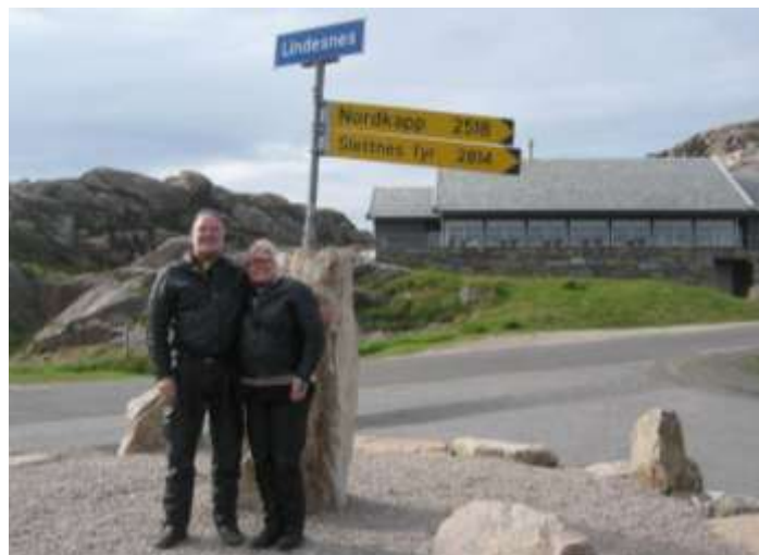
Norges sydspets. Det är en bit upp till Nordkapp... Dessutom norska vägar... ;-)

*) Rättelse: Nordkapp är egentligen inte den nordligaste punkten i Norge och Europa. Nordkapp är inte ens Magerøyas (ön där Nordkapp ligger) nordligaste punkt. Knivskjellodden på samma ö sträcker sig ytterligare cirka 1,5 kilometer längre norrut. Det europeiska fastlandets nordligaste punkt är Kinnarodden cirka 60 kilometer österut. (Källa: Wikipedia)