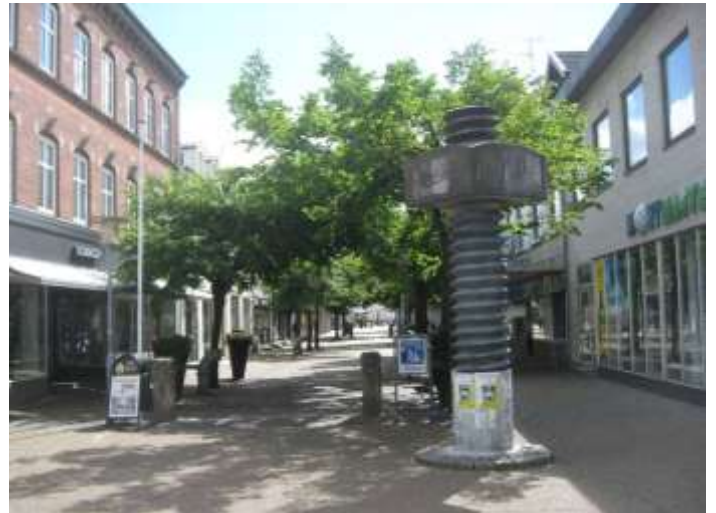
Fredrikshavns gågata med dess stolta obelisk ”Skrue og Mutter”.

Så var det äntligen dax att åka upp till Skagen och ”Grenen” (spetsen). Mycket trafik på den enda vägen. Men så är det oxå semesterid. Och alla måste ju ut på Grenen!