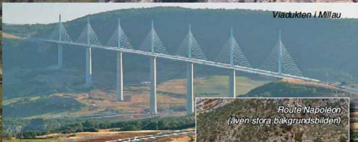
Viadukten i Millau