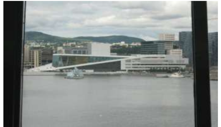
Oslos nya opera sett genom akterfönsterna på Pearl Seaways.