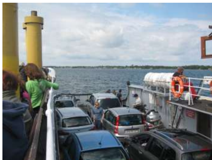
Färja Hundested – Rørvig. Hundested i bakgrunden. Den garvade färjekarlen sitter vid frälsarkransen och pustar ut efter välförrättat värv.

Första anhalt var Hundested där vi tog färjan till Rørvig. Färjan var den minsta jag åkt med. Plats för 12 bilar (trångt) och en Guldvinge. Färjan går endast under sommartid som förstärkning till ordinarie färja som är lite större. Och en garvad färjkarl som muntrade upp alla ombord. Hans instruktioner för att få in så många bilar som möjligt förgyllde dagen för de flesta. Överfarten tog ca 25 minuter.