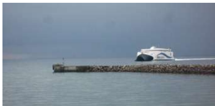
Mols-linjens katamaran stävar in i full karriär. Åskmolnen tornar upp sig hotfullt i bakgrunden.

En kort bit och vi var framme vid nästa färja: Sjællands Odde – Ebeltoft. Lite längre tur än förra: 55 minuter.