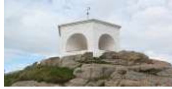
En av de äldre fyrarna som ännu finns kvar och som eldades med ved.