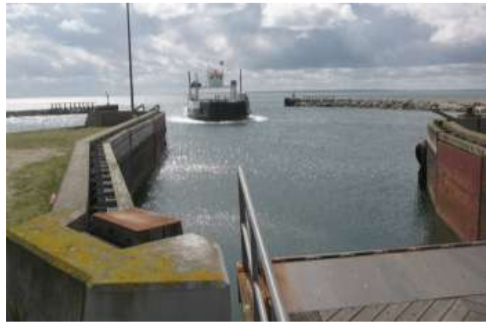
Färja över Thyborøns kanal vilken vi INTE åkte med.

I Fredrikshavn passade vi på och åt lunch och tog en promenad på gågatan. Vi fick aldrig nån förklaring på deras ”monument”; en skruv och en mutter???. Undras vad det ska symbolisera?