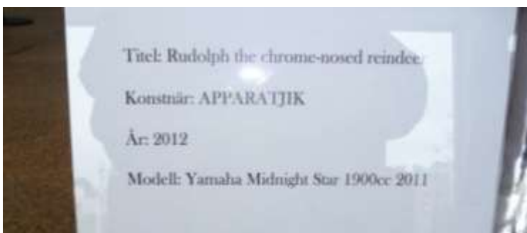
Skylt som talar om vad vi tittar på...

roll. Yves Klein målade nakna kvinnor blå och lät dem rulla sig på pappersark på golvet. Performance låter personer framträda med ett stilla spel eller en utåtriktad happening eller vad nu kreativiteten bjuder. Att rulla blå kvinnor är konst. Att köra på bakhjulet inför publik och skrapa bort baklyktan eller elda däck räknas nog inte som performance ännu. 1920-talets flygplansmotorer på teaterscen med äggkastande publik var inte konst då och anses nog fortfarande höra till dekadensen. Liksom bak-